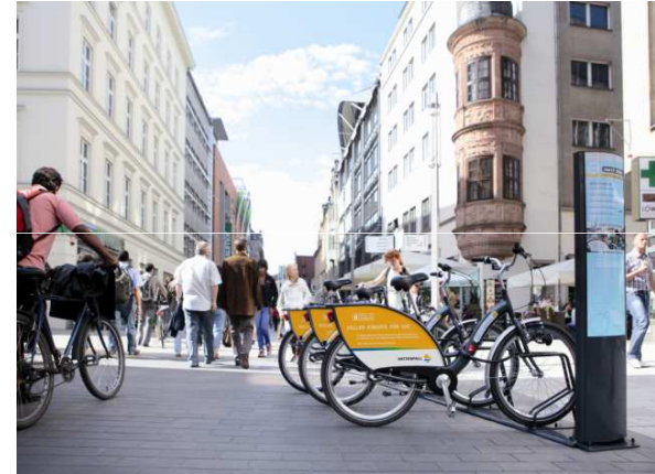
nextbike - Station mit Stele