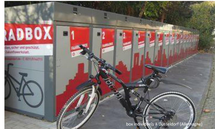
box individuels à Düsseldorf (Allemagne)