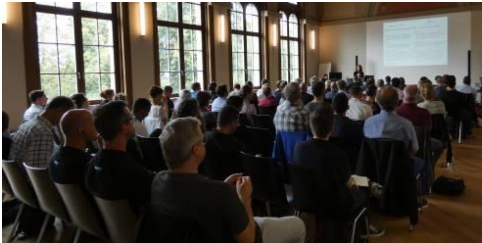
Rencontre d'information du Forum vélostations Suisse : visite de la vélostation Schanzenbrücke à Berne inaugurée en 2000 et rénovée 2017